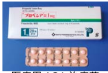
医療用 AGA 治療薬

A=行うよう強く勧められる / B=行うよう勧められる / C1=行うことを考慮しているが、十分な根拠がない / C2=根拠がないので勧められない / D=使用しないよう勧告