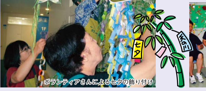
ボランティアさんによる七夕の飾り付け

もらいました。ボランティアの皆さん御協力により、今年も楽しい時間を過ごすことができました。