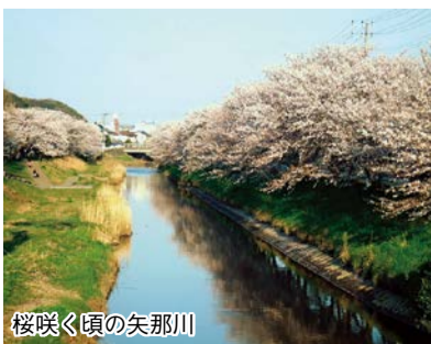
桜咲く頃の矢那川

矢那川は木更津市草敷付近(アカデミアパークの奥)に源を発し、木更津市街を貫流し東京湾に注ぐ二級河川である。 河口付近には、たぬきはやしで有名な證誠寺が、その少し上流には写真のような見事な桜並木があり、4月上旬には矢那川桜祭りが開催され多くの人でにぎわう。かずさアカデミアパーク付近には矢那川ダムがあり、ダム周辺には駐車場や公園が整備されていて静かな時を過ごせるかくれスポットとなっている。公園には、藤原鎌足が矢那に立ち寄った時に桜で作った杖を土に刺したまま立ち去ったところ、根を張って芽生えたという言い伝えがある。鎌足桜も移植されている。