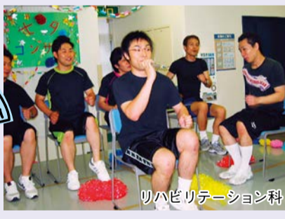
リハビリテーション科