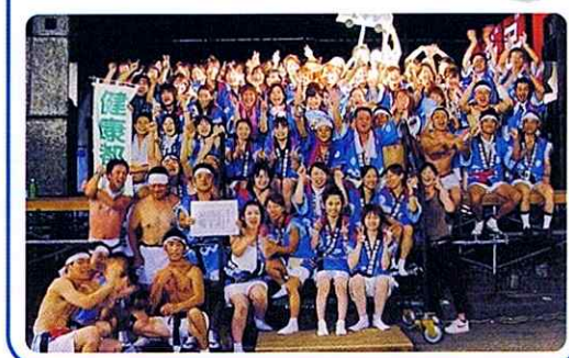
「フルーハワイ」のハチカマ作りに参加

サブタイトルは「ききょう」 桔梗(ききょう)は、秋の七草のひとつとして知られており、紫または白の美しい花が咲きます。 「桔梗は昔「朝顔」と呼ばれていたこともあるようで、万葉集の「朝顔は朝露負いて咲くといへど夕陰にこそ咲く」とあるように、夕陰にこそ咲く花です。 「桔梗は昔「朝顔」と呼ばれていたこともあるようで、万葉集の「朝顔は朝露負いて咲くといへど夕陰にこそ咲く」とあるように、夕陰にこそ咲く花です。