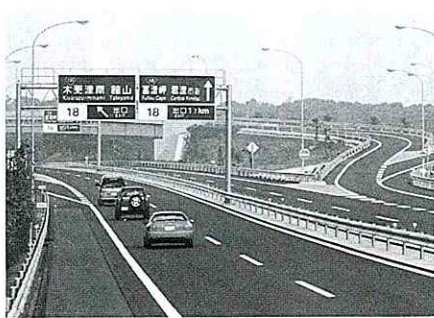
館山自動車道(東関東自動車千葉富津線)は、京葉道路終点部から千葉市、市原市、