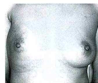
「右乳がん乳房温存手術後」

ることで、機能的にも美容的にも大変に良い結果が得られている。しかもこの手術が広く行われるようになった結果、手術を縮小しても乳がんの生存率に差が出ないということが外科医の間で広く認知されることになった。これはすなわち以前から一部に主張されていた「乳がんはかくなり早期の段階からすでに全身的な病気であつて、局所の治療法(手術法)の違いはその生存率に変化を及ぼさない」との考えが正しいことが証明される結果となった。